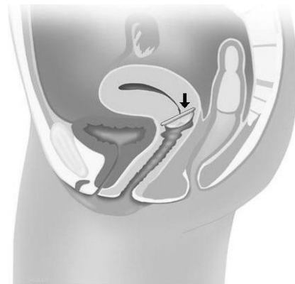
Figuur 4. Barrièremiddelen; het pessarium

De barrièremiddelen verhinderen het binnendringen van de zaadcellen in de baarmoeder. Het meest bekend is het condoom voor de man. Voor de vrouw zijn er het vrouwencondoom, het pessarium occlusivum (de ring) en het siliconenkapje. Om de betrouwbaarheid te verhogen is het nodig deze middelen te combineren met zaaddodende crème of pasta. Behalve tegen zwangerschap beschermen condooms ook tegen seksueel overdraagbare aandoeningen.