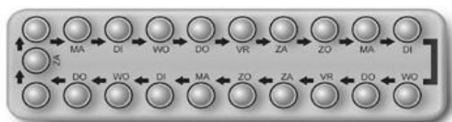
Figuur 1. Hormonale anticonceptiepil; de pilstrip

De pil moet je elke dag, het liefst op een vast tijdstip, innemen gedurende 21 of 22 dagen; daarna volgt een stopperiode van maximaal 7 dagen. In deze stopperiode is er meestal een bloeding van enkele dagen. Begin met een nieuwe strip op een vaste dag van de week. Doorslikken van de pil zonder stopweek is mogelijk, maar de manier waarop is afhankelijk van de samenstelling van de pil die je gebruikt. Overleg bij twijfel met je arts. De meeste pillen zijn eenfasepillen: elke pil heeft dezelfde samenstelling. Twee- en driefasepillen hebben twee respectievelijk drie verschillende samenstellingen na elkaar; ook hier is er een stopweek. Voor het slikken van de pil moet je dus bij de twee- en driefasepillen, goed op de volgorde letten (zie ook: Wat als de anticonceptie vergeten of niet goed gebruikt is?).