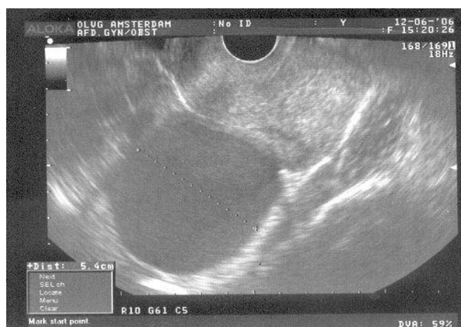
Figuur 2. Inwendige echoscopie bij endometriose: u ziet de eierstokken met endometriomen.

Tijdens de menstruatie is de endometriose het beste te ontdekken en te beoordelen. Als u toevallig niet ongesteld bent op de dag van het inwendige onderzoek, hoeft u die afspraak dus niet af te zeggen. Zie voor meer informatie over het gynaecologische onderzoek de brochure: Eerste bezoek aan de gynaecoloog.