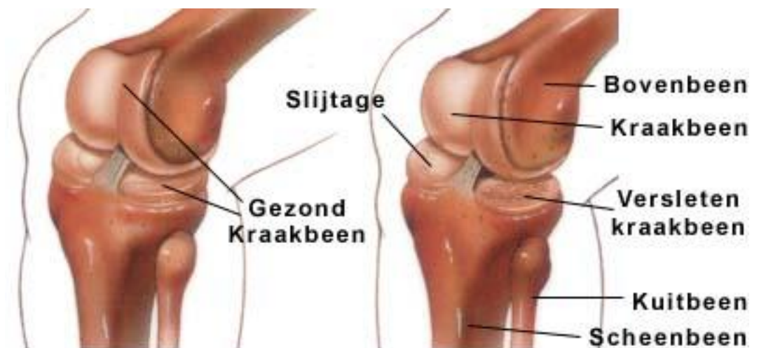
Figuur 1: gezond kraakbeen en slijtage van het kraakbeen in het kniegewricht

Slijtage van de gladde kraakbeenlaag in het gewricht is meestal de reden voor een knieoperatie (zie figuur 1). Doordat de gewrichtsvlakken niet meer soepel langs elkaar kunnen glijden, wordt het bewegen steeds moeilijker en pijnlijker. Bij u functioneert het kniegewricht zo slecht, dat het vervangen moet worden door een knieprothese.