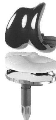
Figuur 2: Knieprothese