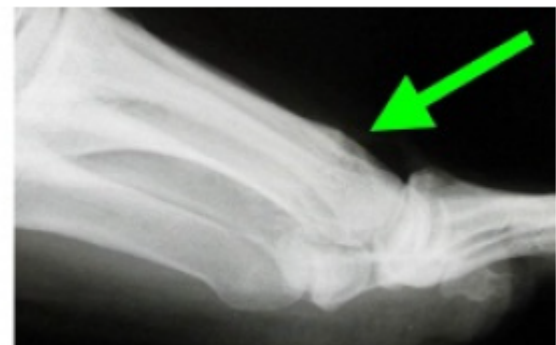
Zijaanzicht ná cheilectomie