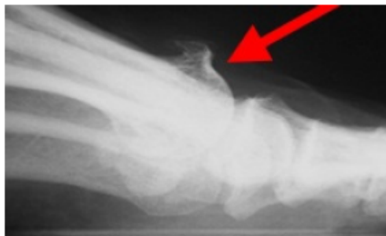
Zijaanzicht vóór cheilectomie

Bij deze operatie, die alleen mogelijk is als het gewricht nog niet té erg is aangetast, worden alle botuitsteeksels (de osteofyten) verwijderd, met name aan de bovenkant en zijkanten. Hierdoor verdwijnt niet alleen de bult aan de bovenkant, maar neemt ook de beweeglijkheid meer of minder toe. Het nadeel is dat de slijtage in het gewricht blijft bestaan. Deze kan in de loop van de tijd toenemen en ook weer klachten geven. Het voordeel is natuurlijk dat het gewricht beweeglijk blijft.