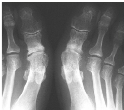
Na Brandes operatie beiderzijds

Dit is de meest toegepaste operatie voor een matige tot ernstige hallux rigidus. Het gewricht wordt vastgezet in een functionele stand, die dus enige afwijking toelaat. Dit gebeurt met een plaatje en/of schroefjes. Dit resultaat is permanent en de pijn is voor de rest van het leven opgeheven. Het nadeel is duidelijk: de grote teen kan niet meer bewegen in het gewricht met het eerste middenvoetsbeentje. Er blijft overigens wel beweeglijkheid bestaan in het gewrichtje tussen de twee kootjes van de grote teen zelf. De artrodese is een ingreep, die in Gelre ziekenhuizen vaak via een dagopname wordt verricht. De nabehandeling is met 6 weken achtervoet belaste schoen.