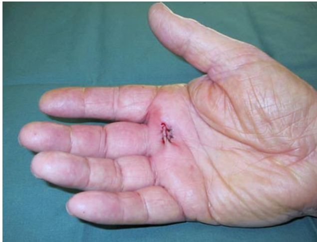
Figuur 2. Hand na hechting van kleine snede

Met een kleine ingreep wordt via een kleine snede (1,5 cm) de peesschede in de lengte richting geopend. Hierdoor ontstaat ruimte voor de peesverdikking. De huid wordt vervolgens gehecht en verbonden (zie figuur 2). De ingreep duurt ongeveer 20 minuten en vindt poliklinisch plaats onder lokale verdoving.