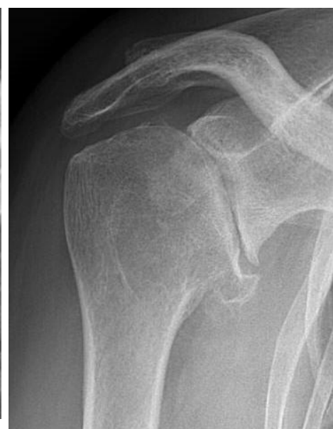
Ernstige artrose met vervorming van de schouder

Patiënteninformatie wordt met de grootste zorg samengesteld. Het betreft algemene informatie.