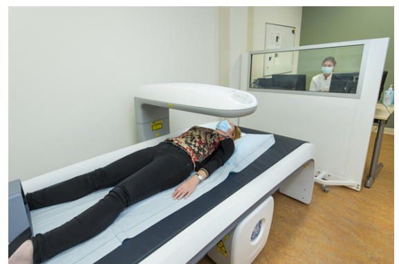
Afbeeldingen: DEXA Scan, Gelre ziekenhuis