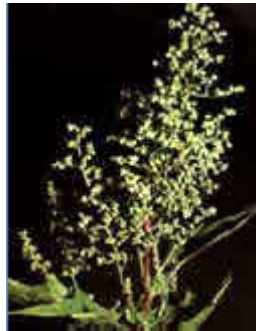
Figuur 2. Bloeiend gras, veroorzaker van hooikoorts.