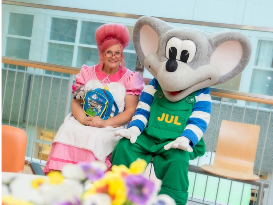
Fragment uit de voorlichtingsfilm 'Jul de Muis krijgt Oorbuisjes'