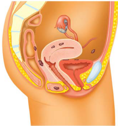
Figuur 1a. zijaanzicht