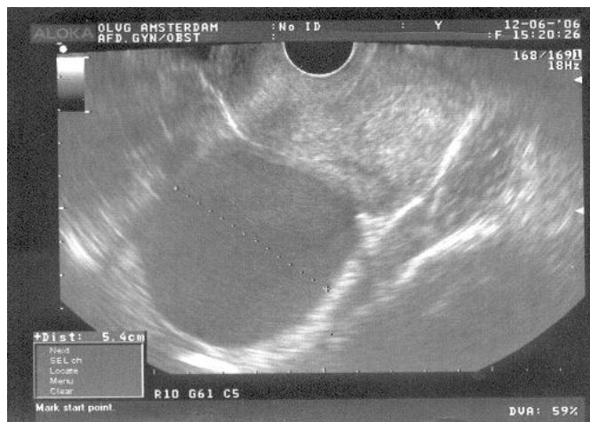
Figuur 2. Inwendige echoscopie bij endometriose: u ziet de eierstokken met endometriomen.