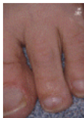
Figuur 1. Normale huid

In de normale situatie is de huid over de tenen slank met kleine rimpeltjes. Omdat er slechts weinig tot geen vetweefsel zit, is de huid goed op te tillen (zie figuur 1 en 2).