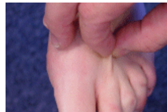
Figuur 2. Normale huid, negatieve proef van Stemmer

Aan de benen kan de zwelling langzaam ontstaan. Aanvankelijk is de zwelling vaak alleen 's avonds aanwezig of na forse inspanning. Ook kunnen de tenen iets opgezet zijn. Dit kan heel goed een eerste uiting van lymfoedeem zijn (zie figuur 3).