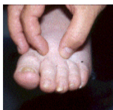
Figuur 4. Positieve proef van Stemmer

Een karakteristieke zwelling van de tenen vormt vaak een eerste verdenking op lymfoedeem. Als men met de vingers de huid tussen de 1e en 2e teen beet pakt, dan moet dit een dun plooitje opleveren (zie figuur 2). Dit heet de Proef van Stemmer. Als er verdikking van het onderhuidse weefsel is, hetgeen een sterke aanwijzing voor lymfoedeem is, spreekt men van een positieve proef van Stemmer (zie figuur 4 en 5).