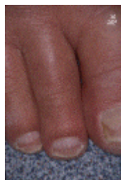
Figuur 3. Beginnende lymfavloedbeperking met (vaak tijdelijke) zwelling van de tenen

Aan de benen kan de zwelling langzaam ontstaan. Aanvankelijk is de zwelling vaak alleen 's avonds aanwezig of na forse inspanning. Ook kunnen de tenen iets opgezet zijn. Dit kan heel goed een eerste uiting van lymfoedeem zijn (zie figuur 3).